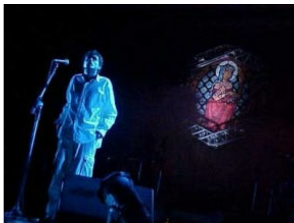
No cenário atual, vitrais com motivos variados. Em destaque, a Santa. 2002.

Outro fato de forte simbologia, assim como as mudanças já comentadas, é que o Cordel do Fogo Encantado , que antes trazia um importante elemento cênico nos momentos em que Lirinha declamava poemas durante os espetáculos: um candeeiro (lâmparina). Hoje, em momentos semelhantes do show há na palma de cada mão do líder da banda dois pontos de neom azul, que podem ser considerados partes da nova iluminação do show, assim como o novo cenário, figurinos, entre outros. Com isso, é possível retornar às idéias de Canclini, que nos apresenta uma cultura popular dinâmica, apesar de diferente, híbrida na contemporaneidade, não ficando à margem de fenômenos que ocorrem exclusivamente nos campos popular, erudito e massivo.