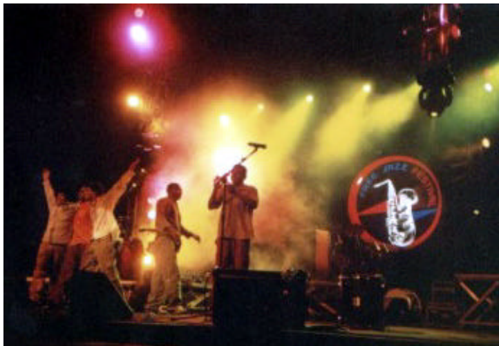
Apresentação no Free Jazz Festival, 2001, São Paulo. (Foto retirada do site www.cordeldofogoencentado.hpg.com.br ).

Cavalera), iluminação e cenário, mas uma essência quase que intocável em se tratando da poesia e força cênica, presentes desde o primeiro show do Cordel. No entanto, a chama do candeeiro cede espaço às de luzes de néon, localizados nas mãos do declamador do Cordel.