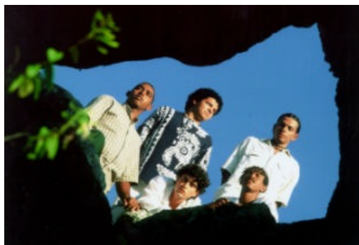
Produção para a mídia. (Foto: Vlândia Lima, Jornal do Commercio, 2002).