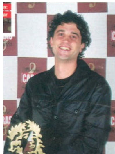
Melhor grupo regional 2002, concedido pelo Prêmio Caras de Música. (Foto: Fernando Lemos, Revista Caras).