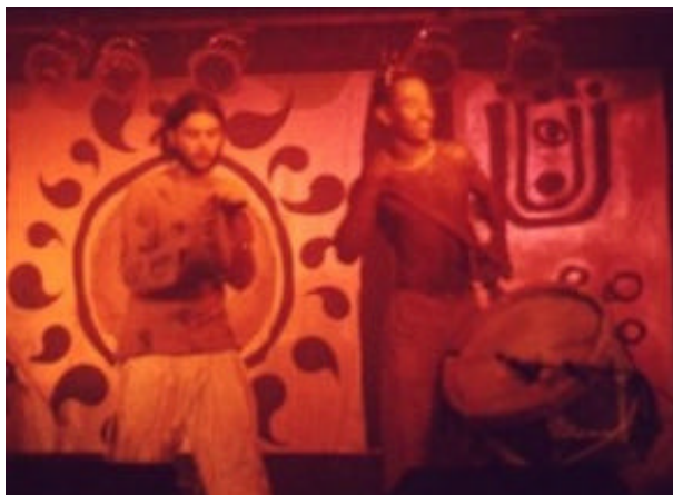
Primeiro cenário da banda em 1999: painéis com pinturas que remetem à arte rupestre. (Foto retirada do site www.entrecantos.com.br ).