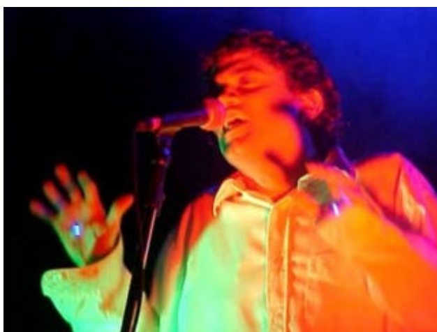
Em 2002 o candeeiro dá lugar ao neon.